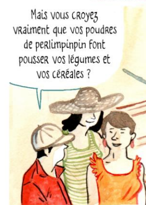
3. Les membres de l'association "Biodynamie Fédération - Demeter International" sont présents dans 65 pays à travers le monde.

Mais vous croyez vraiment que vos poudres de perlumpinpin font pousser vos légumes et vos céréales ?