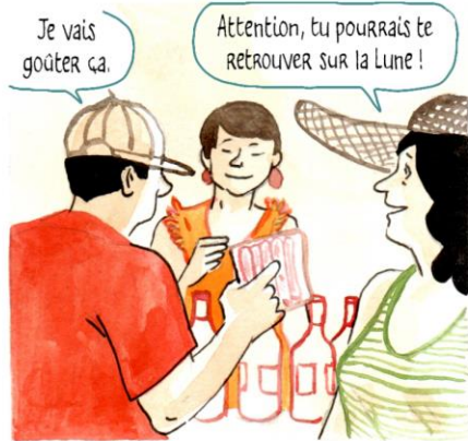
2. En France, il existe aussi le label Biodyvin pour le vin.